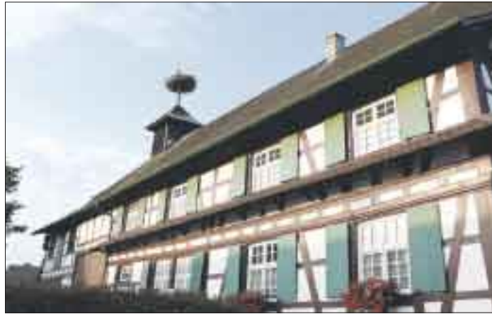
Das alte Rathaus von Auenheim.