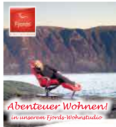
Abenteuer Wohnen! in unserem Fjords-Wohnstudio

Achern. Auch zum Ende des auslaufenden Jahres 2009 bietet Möbel Seifert allen Interessenten, die sich mit einem „schönen Zuhause“ beschäftigen, viele neue Anregungen.