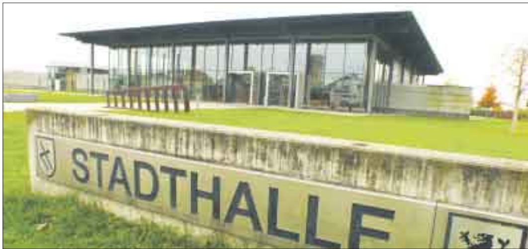
Alles steht aktuell auf dem Prüfstand, auch das reichhaltige Programm der Stadtkultur in der Freistetter Stadthalle.