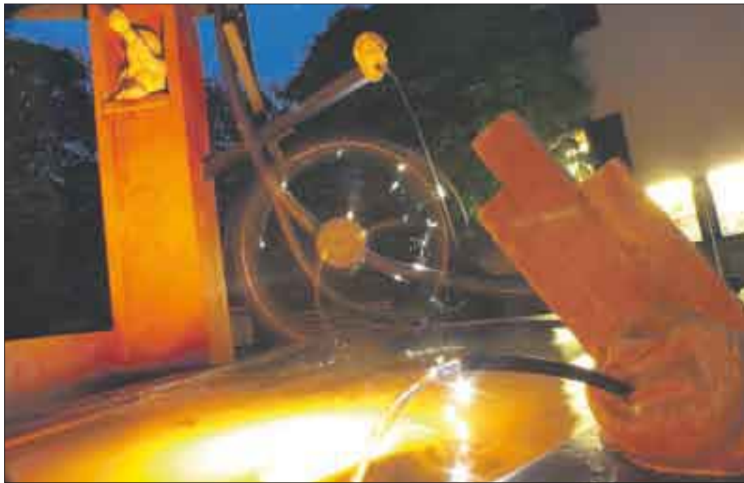
Neumühl liegt direkt an der B 28, hat aber einiges zu bieten.

960 Arbeitsplätze bietet die Diakonie Kork und ist damit der größte Arbeitgeber in Kehl. Konzentriert sind die Aktionen des Epilepsiezentrums bislang auf Kork und das große Klinikgelände, auf dem seit Jahren die Kliniken erweitert und ausgebaut werden, so setzt in Sachen Wohnen die Diakonie nun auf Dezentralität. In Goldscheuer und in Willstätt entstehen gerade zwei Wohnhäuser für behinderte Menschen. Ziel des Projektes ist es, sie in die Dorfgemeinschaften zu integrieren. In unmittelbarer Nachbarschaft gibt es Einrichtungen für Senioren.