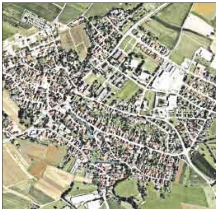
Rheinbischofsheim im Blick von oben.

Nicht nur den Friedwald – die Genehmigung erwartet man täglich – sieht Pollok als positives Beispiel. Weiter führt er an, dass man angesprochen wird, beim Wettbewerb „unser Dorf hat Zukunft“ mitzumachen. Kleinere ökologische Maßnahmen sollen genauso zur Attraktivität Mempredtshofens beitragen wie günstige Bauplätze auch in Zukunft.