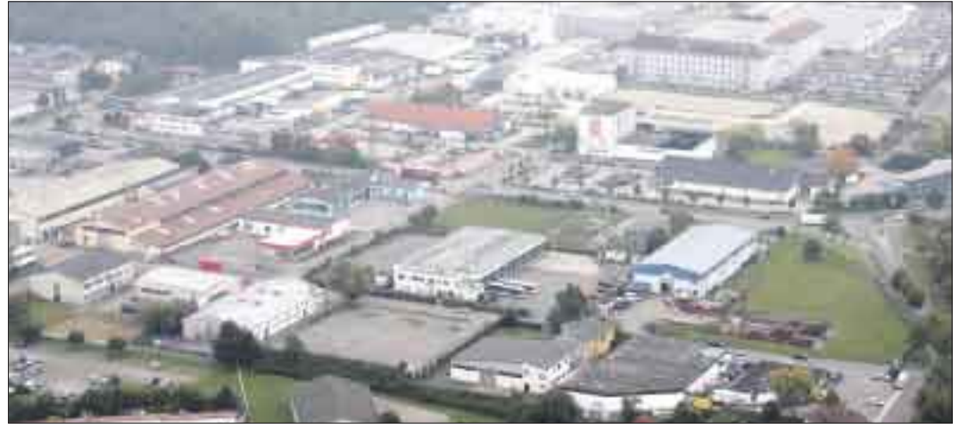
Ein neuer Bebauungsplan vom Oktober 2009 regelt die weitere Entwicklung des Gewerbegebiets Sundheim.

Das Vorhaben wurde in einer Bürgerinformation vorgestellt, Anregungen der Bürger bereits eingearbeitet. Neun Millionen Euro müsste die Stadt investieren, um die Quartiere Kehl-Dorf und Sundheim aufzuwerten.