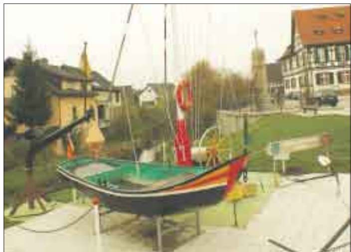
Nicht nur im Freistetter Rathaus (r.) werden aktuell Pläne für die Zukunft geschmiedet.

2013 mit rund 1,2 Millionen Euro zusätzlichen Kosten pro Jahr hochgerechnet. Zu deren Finanzierung stellen Gemeinderat und Verwaltung derzeit alle städtischen Aufgaben und Leistungen auf den Prüfstand. Dabei steht auch die Häufigkeit der Nutzung bestimmter Einrichtungen und Leistungen durch die Rheinauer selbst im Vordergrund. Speziell kostenintensive freiwillige Leistungen wie zum Beispiel die Städtischen Hallenbäder, werden im Gemeinderat unter die Lupe genommen. Aber auch die Einnahmesituation wird intensiv beleuchtet. Steuer- und Gebührenerhöhungen werden vom Gemeinderat diskutiert und deren Auswirkung ermittelt. Die Verwaltung trägt in den nächsten Tagen und Wochen alle erforderlichen Daten und Fakten zusammen, um schließlich fundierte Entscheidungen für die Zukunft treffen zu können.