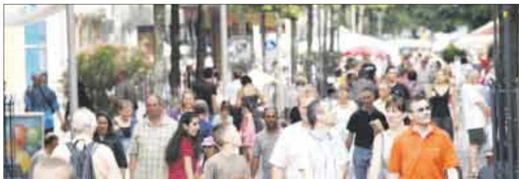
An den verkaufsoffenen Sonntagen ist die Kehler Innenstadt voll. Einkauf mit Eventcharakter kommt bei den Kunden an.

Die Planer haben gute Einfälle: In einem Entwurf gibt es Anbauten, die alle zusätzlichen Einrichtungen aufnehmen können. Eine Tiefgarage würde das Parkplatzproblem in diesem Teil der Stadt nicht nur während der Veranstaltungen lösen. Die Entwürfe hängen derzeit im Technischen Rathaus aus. gro