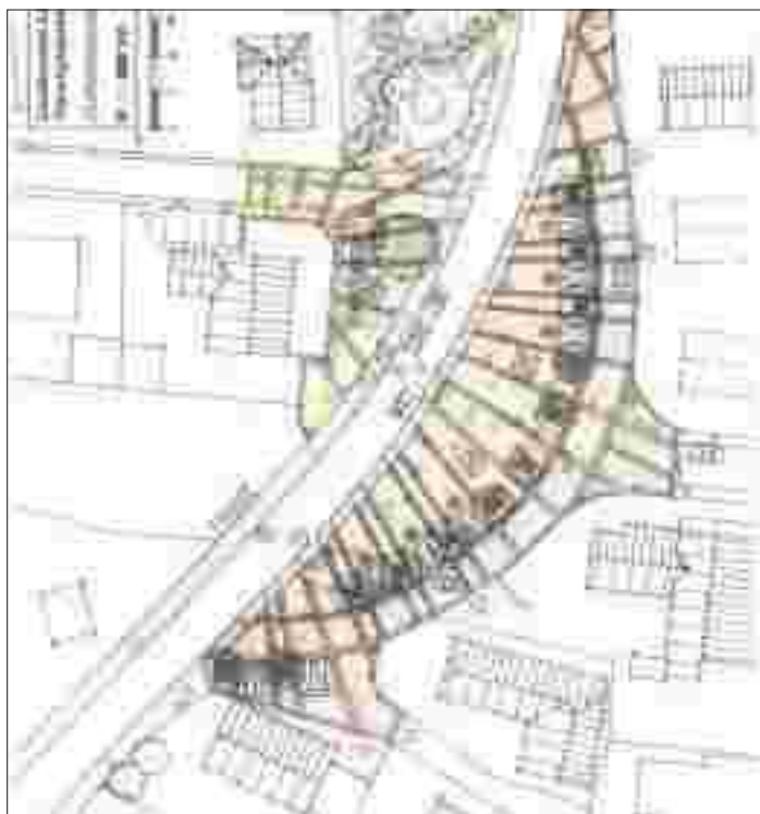
Ein erster Vorentwurf zeigt die geplanten Veränderungen in Marlen. Plan: Stadt Kehl

Der Förderverein Kittersburger Dorfleben besteht 2010 seit 15 Jahren. Ein Grund für den Ort vom 21. Juli bis 2. August zu feiern.