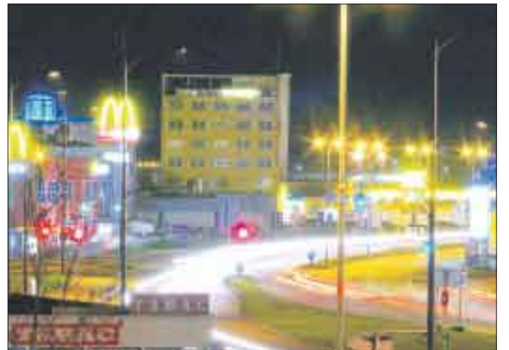
Das Gewerbegebiet Lager liegt auf beiden Seiten der B 28/ Straßburger Straße.