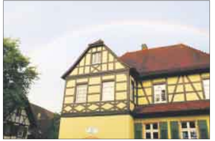
Der Kindergarten Auenheim wird für Kleinkindgruppen ausgebaut.