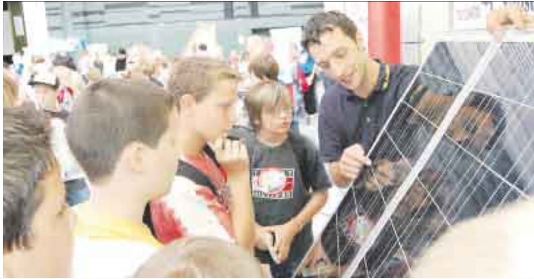
Neue Energien sind nicht nur für die Kleinen – wie hier beim Energietag – in Willstätt ein zentrales Thema.