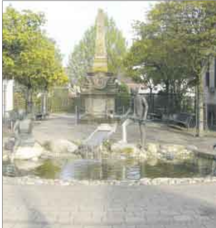
In Goldscheuer wird der konjunkturellen Entwicklung bewusst entgegensteuert.

leitung erneuert werden. Bei entsprechendem Interesse kann auch eine Gasleitung verlegt werden. Die Regenwasser- und Schmutzwasserkanalisation muss saniert werden. Dazu gehört auch die Verkabelung der Stromversorgung. Zur Maßnahme gehört auch eine energiesparende Straßenbeleuchtung in Marlen und Goldscheuer.