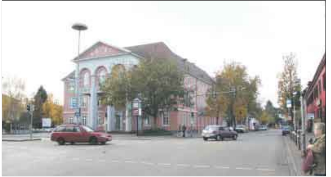
Trennend wirken sich die Hauptstraße und Großherzog-Friedrich-Straße aus. Die Neugestaltung des Rathausumfeldes soll dies ändern.

● Zur Weihnachtszeit planen wir neben der Nikolausstiefelaktion und dem Adventskino einen Schaufensterwettbewerb und das Aufstellen von Tannensäulen, die durch Kindergärten und Einzelhändler geschmückt werden. Auch in Zukunft werden Events, die das Einkaufen zum Erlebnis machen, immer mehr nachgefragt werden. Hierbei ist es wichtig, dass die Einzelhändler selbst Maßnahmen und Aktionen zur Kundenbindung umsetzen. Letztlich kann sich der Einzelhandel einer Stadt nur über die persönliche Note, besondere Erlebnisse und Anlässe sowie Qualität und perfekten Service profilieren. Die Stadt arbeitet zur Zeit unter anderem an ein Beschilderungssystem für die Parkplätze und kann somit ebenfalls einen Beitrag leisten. gro