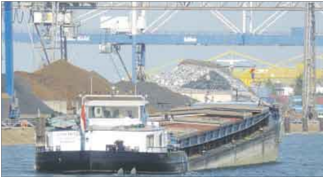
Vom Schiff auf Bahn und Lkw, der Kehler Hafen bietet perfekte Logistik.

tige Umschlag im Rheinhafen gut: Das Ergebnis der ersten neun Monate liegt in Höhe mit den Zahlen des Rekordjahres 2008, in dem insgesamt knapp vier Millionen Tonnen über die Kaimauern gingen. Mit seiner wasserseitigen Verkehrsleistung rangiert der Rheinhafen Kehl unter den über 100 öffentlichen Binnenhäfen Deutschlands auf Platz acht, in Baden-Württemberg nach Mannheim, Karlsruhe und Heilbronn auf Rang vier.