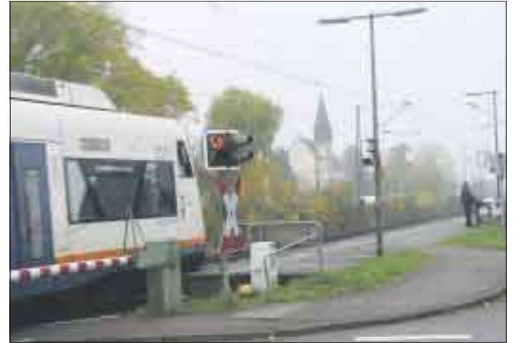
Mit dem Ausbau der Bahntrasse für den TGV wird sich auch der Bahnübergang Kork verändern.

In der Schwebe hängt noch bis Ende des Monats die weitere Entwicklung der Grund- und Hauptschule Kork: Geht es nach dem Willen des Gemeinderates,