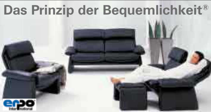
Das Prinzip der Bequemlichkeit®