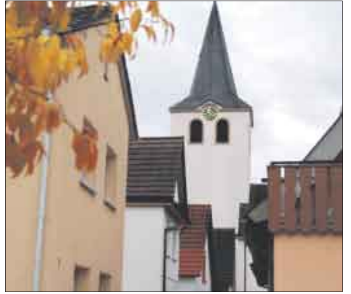
Idyllische Gassen – so erscheint Lichtenau im herbstlichen Licht.

Die Stadt liegt nur wenige Kilometer von der Nord-Süd-Autobahn Karlsruhe – Basel entfernt, der Achse, die Nordsee und Mittelmeer verbindet. Das nur 25 Kilometer entfernte Straßburg mit seinem internationalen Flughafen bietet Anschlüsse an Großstädte in aller Welt. Die badische Metropole Karlsruhe – Zentrum der Technologieregion, der auch Lichtenau angehört – liegt ebenfalls nur wenige Autobahnkilometer entfernt. Lichtenau verfügt über zwei Gewerbegebiete mit einer freien Fläche von zehn Hektar. Sorgfältig geplantes Wachstum unter Berücksichtigung der Anforderungen von Natur- und Umweltschutz sichern den Bewohnern Lebensqualität und eine intakte Umwelt.