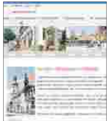
Die Willstätter Homepage wurde jüngst überarbeitet.