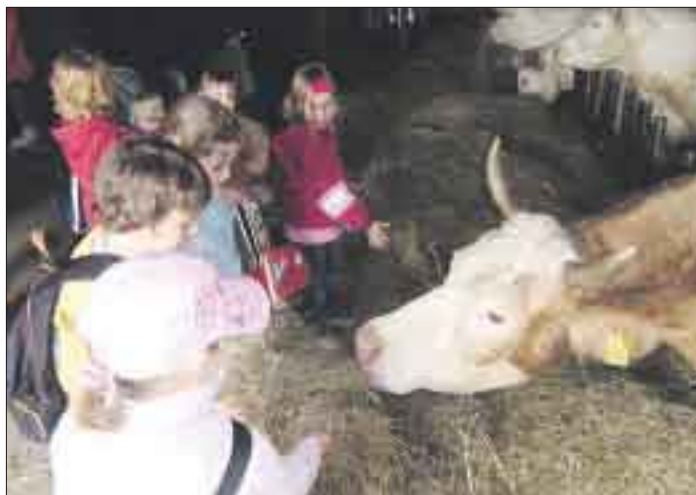
Für Kinder ist in Rheinau viel geboten.

Eine Haushaltssperre wurde bereits im Sommer erlassen. Insgesamt wurden so vom Rheinauer Gemeinderat Maßnahmen mit einem Gesamtvolumen von 630000 Euro gestoppt. Neben den Kürzungen steht für die Verwaltung aber im Vordergrund, Rheinau fit für die Zukunft zu gestalten: „Genauso wichtig ist es uns aber, über die Finanzierung der neuen Herausforderungen wie Kleinkinderbetreuung, Breitbandversorgung, ausführlich zu sprechen“, erklärt Hauptamtsleiter Thomas Bantel: „Leider gibt der Haushalt auch aufgrund der besonderen Struktur der Stadt Rheinau mit einer immensen personal- und kostenintensiven Infrastruktur keinen Spielraum, diese neuen Angebote ohne weitere Maßnahmen zu stemmen.“ Auch Konjunkturpakete der Bundesregierung hat man in Rheinau bereits abgerufen. Bantel: „Insgesamt sind aktuell 42 Einzelmaßnahmen mit einem Volumen von rund 770000 Euro geplant. Davon werden 75 Prozent durch das Konjunkturprogramm bezuschusst. Alle Vorhaben sind energetische Maßnahmen. Mehrere Arbeiten, wie zum Beispiel die Fenstersanierung in der Hauptschule Rheinbischofsheim und die Heizungsanlage der Hans-Weber-Halle in Linx wurden bereits umgesetzt.“