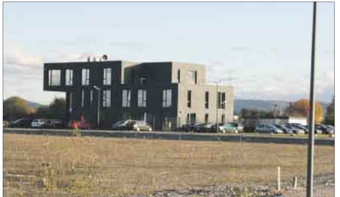
Das Gewerbegebiet Basic kommt langsam in Gang – die ersten Unternehmen haben sich dort angesiedelt. Jetzt steht fest, dass das Land einen Zuschuss von 618000 Euro für die Zukunftsinvestition gewährt.

Es gibt einen ersten Vorentwurf. Zur Zeit laufen die weitere Abstimmungen mit den Anliegern. „Die Realisierung soll mit dem Um- beziehungsweise Rückbau der Kehler Straße im Jahre 2010 erfolgen“, gibt Schüler Einblick in den Zeitplan für die Umgestaltung der Dorfmitte Marlen.