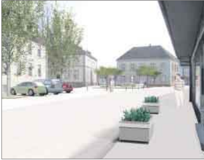
So könnte in naher Zukunft die Kehler Hauptstraße beim Hanauer Museum aussehen.

Auch die Straßenführung wird sich ändern: Bei der Abfahrt nach Eckartsweier ist ein Kreisel geplant, die Stichstraße zwischen Küchenstudio und Kaufland wird nach Norden versetzt.