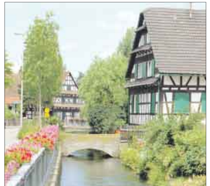
Fachwerk und der Plauelbach prägen das Ortsbild von Odelshofen.

Ein weiteres Ziel ist, die bestehenden Baulücken zu schließen. Denn wenn es auch noch Landwirtschaft in Odelshofen gibt, immer mehr Ökonomiegebäude werden nicht mehr genutzt. Würden diese Gebäude als Wohnraum genutzt werden, könnte weiterer Flächenverbrauch durch die Ausweisung neuer Baugebiete, vermieden werden.