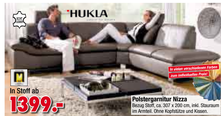
HUKLA LECHT LEDER In Stoff ab 1399.-

Top-Beleuchtung und -Dekoration setzen die Möbel richtig in Szene und runden das Bild vom „Schönen Wohnen“ mit Möbel Seifert ab.