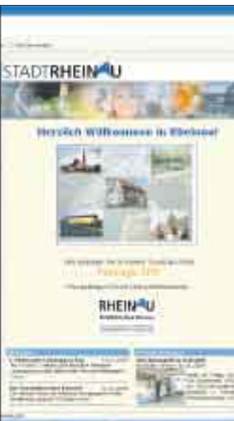
Die Rheinauer Homepage.