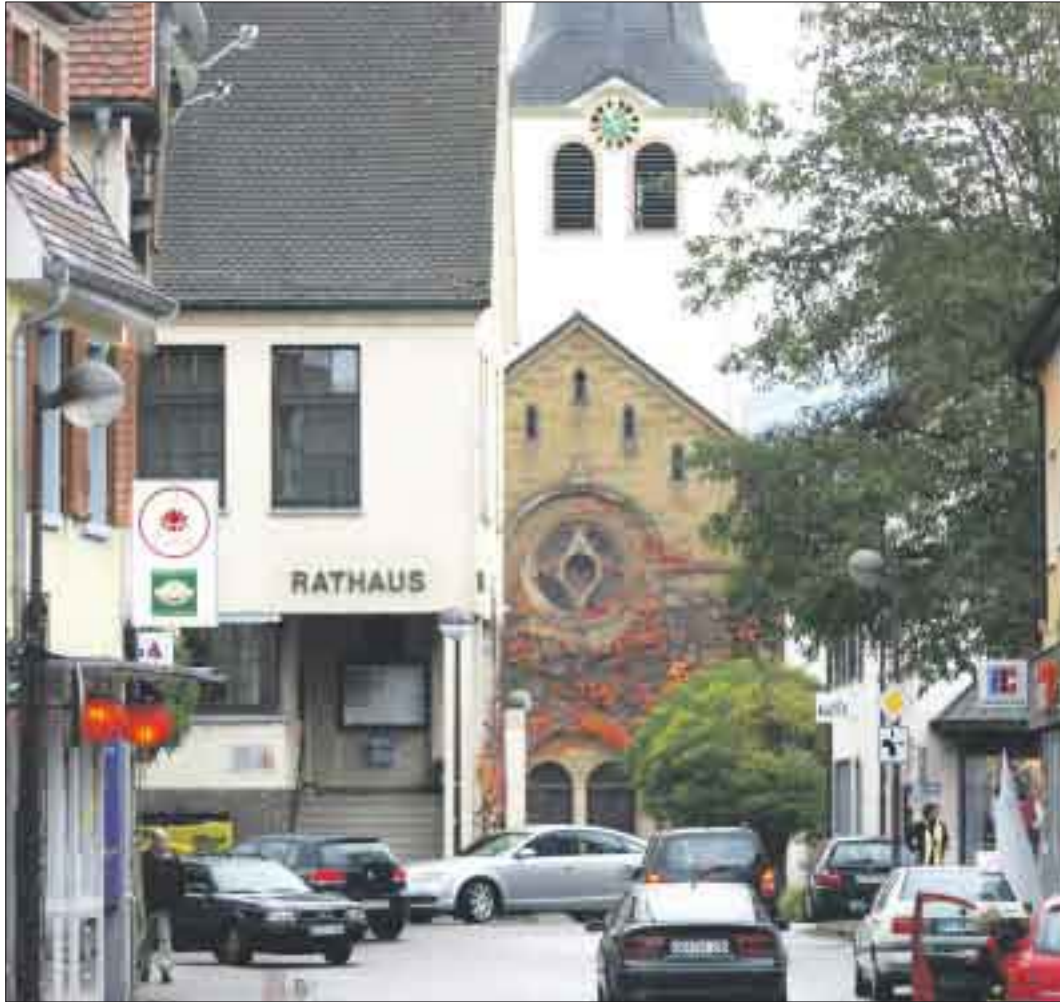
Belebte Innenstadt – hier stimmt die Infrastruktur.

Für Industrie, Handel und Gewerbe stellt Lichtenau ideale Standortvoraussetzungen und eine funktionierende Infrastruktur zur Verfügung.