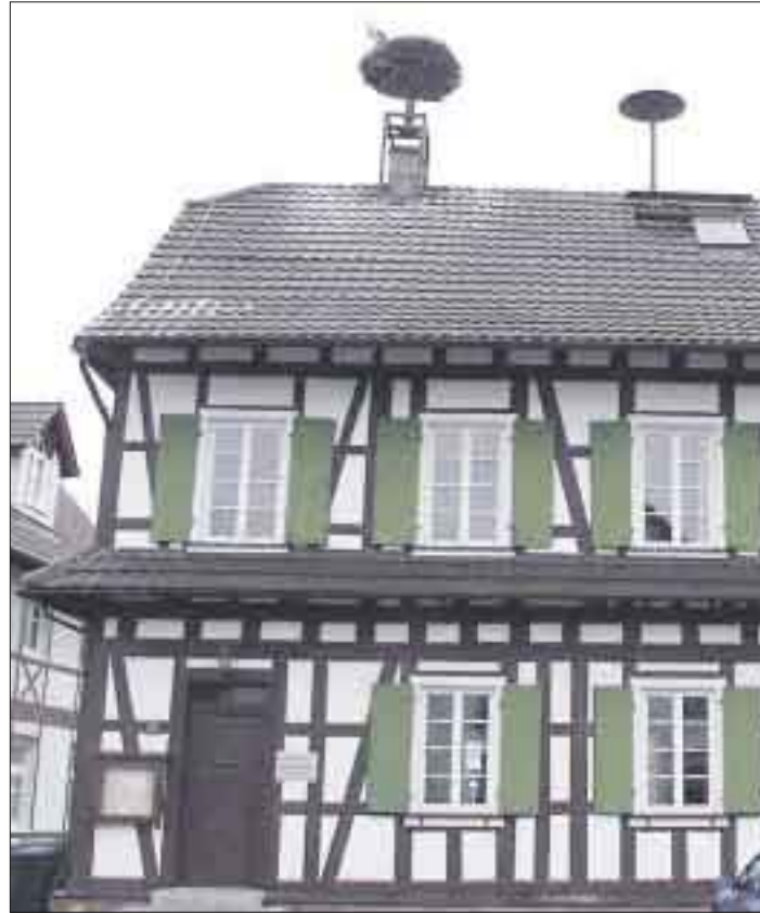
Die Villa Kaps gibt es nicht mehr, das Rathaus in Linx steht aber nach wie vor.

Zur Sicherung der Grundversorgung mit Lebensmitteln stehe man in Verhandlungen für eine Ansiedlung im Ortskern.