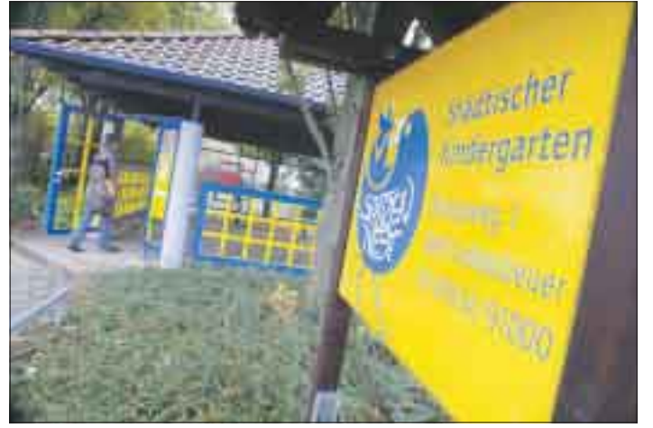
Der städtische Kindergarten Spatzennest wird um 20 Krippenplätze erweitert.