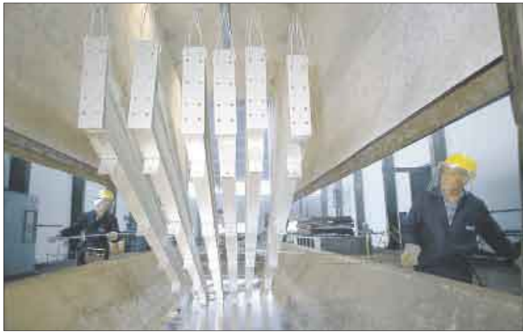
Feuerverzinkt wird nächstens auch in Freistett.

Die Verwaltung der Stadt Rheinau kooperiert auch über die Grenze hinaus. Im regelmäßigen Turnus trifft man sich mit der Verwaltungsspitze von Gamsheim, um den weiteren Weg der interkommunalen Zusammenarbeit voranzubringen. Die Zusammenarbeit wurde durch die Gründung eines gemeinsamen Tourismusvereins gegründet. Der Verein hat für die zu bewältigenden Aufgaben zwei fest angestellte Mitarbeiterinnen eingestellt. Priorität hat dabei ganz klar die Etablierung des Besucherzentrums „Fischtreppe“. Mittlerweile verfügt der Verein über eine Homepage. Unter www.passage309.eu gibt es aktuelle News zum Besucherzentrum sowie Links zu Veranstaltungen in Rheinau und in der Nachbargemeinde Gamsheim. Infos gibt es in Deutsch und Französisch.