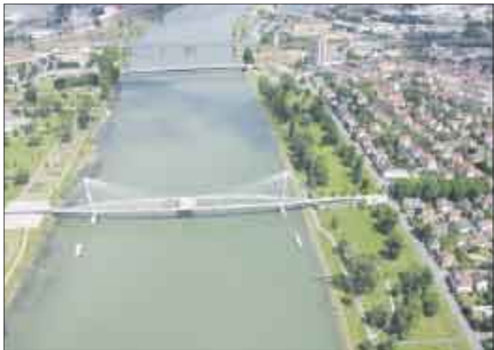
Zu den drei Kehler Brücken soll noch eine weiter kommen, auf der die Straßenbahn fährt.