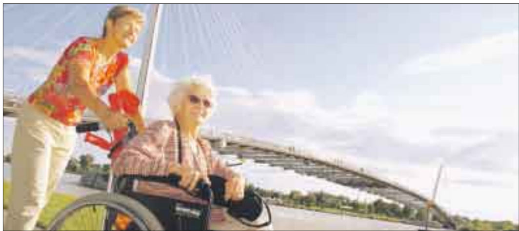
Das Rheinvorland ist ein beliebter Ausflugsort.

Wir müssen uns darüber klar werden, wo und wie wir die städtischen Kultureinrichtungen unterbringen wollen; ich denke, es gibt im Gemeinderat einen Konsens für ein städtisches Kulturzentrum, die Standortfrage ist allerdings noch nicht geklärt. Wir müssen außerdem bald ein Konzept für das historische Gebäude der Tullarealschule finden. Trotz dieser großen Aufgaben konzentrieren wir uns nicht nur auf die Innenstadt, die Kreuzmatt wird ebenfalls zum Sanierungsgebiet im Programm „Soziale Stadt“ – wir möchten dort auch die Straßen und das Wohnumfeld der Menschen verbessern. gro