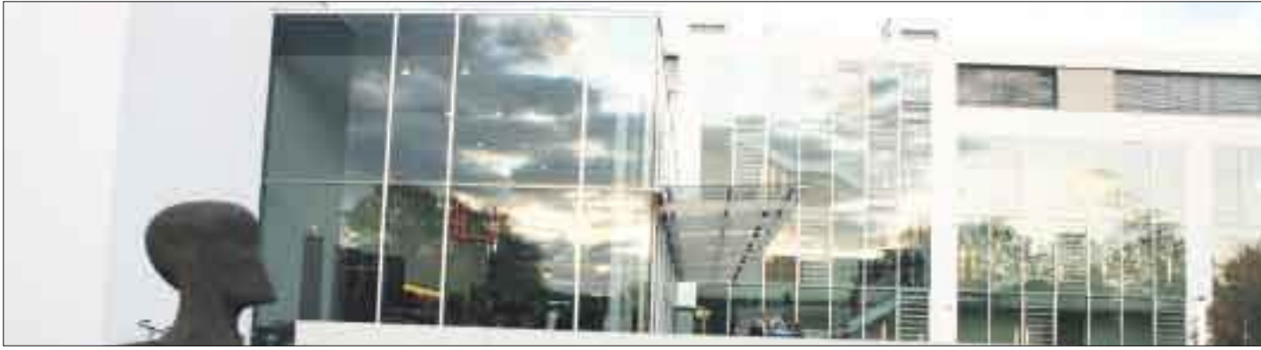
Der Neubau der Hochschule Offenburg im Spiegel der Bildung.