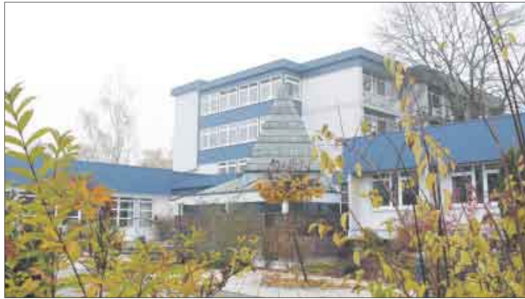
Der größte Arbeitgeber der Stadt Kehl, die Diakonie Kork, entwickelt sich ständig weiter.

Verbesserungswürdig sind auch die Datenleitungen. Wir in vielen Kehler Ortsteilen ist surfen in Kork nur auf der Kriechspur möglich. Auch hier gilt, die Stadtverwaltung hat das Problem erkannt, eine Erhebung über den Bedarf und den Ist-Stand. Dort liegt auch das weitere Vorgehen. Ob und wann es schnelles DSL auch Kork geben wird, hängt von den Verhandlungen der Stadt mit den verschiedenen Anbietern ab. Eine eigene Homepage hat der Kehler Ortsteil nicht – man fühlt sich auf der Seite der Stadt wohl und gut vertreten. gro