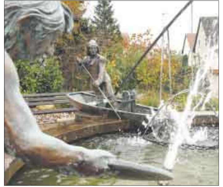
Die Lebensqualität erhalten, ist oberstes Ziel in Leutesheim.

Geht es um schnelle Datenverbindungen steht Bodersweier gut da: Bis zu 16 Mbit/s stehen in dem Ortsteil zur Verfügung. Seit 2007 ist Bodersweier mit einer eigenen, ehrenamtlich betriebenen Homepage im Netz ( www.bodersweier.de ). Aktualisiert wird sie ganz nach Bedarf, das Bodersweierer Amtsblatt wird jede Woche aktuelle eingestellt. gro