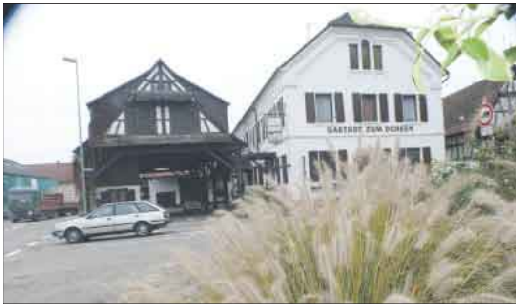
Blick auf die Bodersweierer Hauptstraße.

Sehenswert ist auf jeden Fall der Online-Auftritt des Kehler Ortsteils – unter www.leutesheim.de finden die Einwohner alle interessanten Ereignisse im Ort. Das Bemerkenswerte an der Homepage: Sie ist stets aktuell und das, obwohl sie nur von einer Person ehrenamtlich betreut wird.